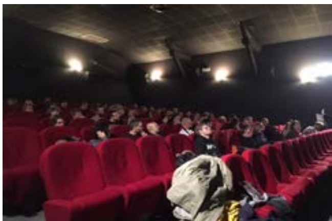
Projection de Stalker au Caméo Commanderie

Cette année fût ponctué par l'arrivé d'un nouveau partenaire, le label d'Ici d'ailleurs, qui nous apporte une aide précieuse pour le ciné-concert.