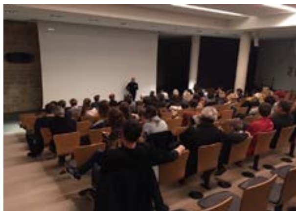
Projection de Bending Space suivi d'une rencontre avec Georges Rousse, à l'auditorium du Musée des Beaux-arts