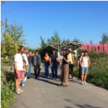
fresque du réemploi organisée dans le cadre de l'exposition

ces formats d'ateliers peuvent être proposés dans différents lieux et adaptés à la demande et aux besoins des publics