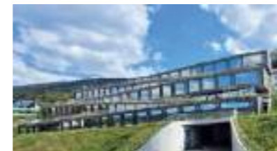
Genève | 7 Septembre 2023, 12 adhérents de la MA74 ont pu visiter l'atelier Audemars Piguet et l'hôtel des Horlogers à Joux dans le Jura suisse projets conçus par Bjarke Ingels Group (BIG).