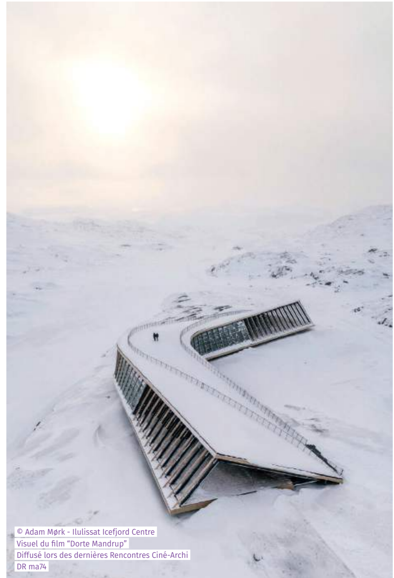
Ilulissat Icefjord Centre Visuel du film "Dorte Mandrup" Diffusé lors des dernières Rencontres Ciné-Archi ma74