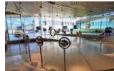
Voyage dans le Jura Suisse | 2023

4 jours pour découvrir Nantes. Gestion/coordination par une architecte référente.