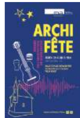
Archi-Fête | 2023