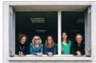
Une partie de l'équipe de la commission cinéma Annecy | juin 2021

L'action phare, désormais incontournable sur la commune d'Annecy et dont La Maison de l'Architecture de Haute-Savoie a fait une part de son identité, a lieu chaque année au Cinéma Le Mikado à Novel. Une programmation de séances tout public et de séances scolaires pensées en fonction des âges (école primaire, collège, lycée). Chaque séance est construite autour d'une thématique qui met en lien une série de films apportant des regards multiples. La commission cinéma de la MA74 composée d'adhérents et d'architectes, tous bénévoles, visionne 100 à 150 films par an et en sélectionne une trentaine. Les films sélectionnés abordent directement l'architecture, le territoire, l'histoire de l'art, l'environnement, l'urbanisme et le paysage. La MA74 propose également un "Hors les murs", transposition de la programmation annécienne, avec pour objectif un élargissement de la diffusion de l'événement au Département et à la Région.