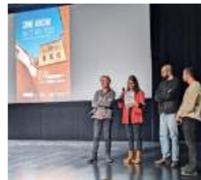
Les 24 e Rencontres du film d'architecture | 2023