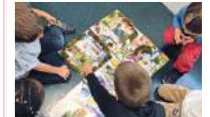
JNA | 2023

Les journées nationales de l'architecture ont pour objectif de développer la connaissance architecturale du grand public et de susciter le désir d'architecture.