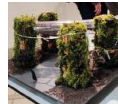
Ateliers dans les classes | 2023