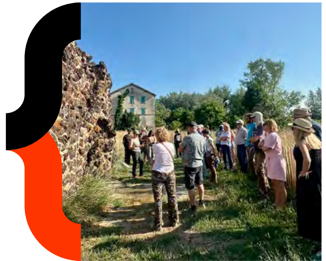
MA Auvergne - Réenchanton les thermes de St Marguerite - St Maurice - 2025

Ralentir. Faire une pause. Prendre du recul. C'est ce que nous nous étions promis il y a cinq ans.