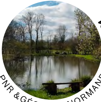
PNR & GÉOPARC NORMANDIE-MAINE 16