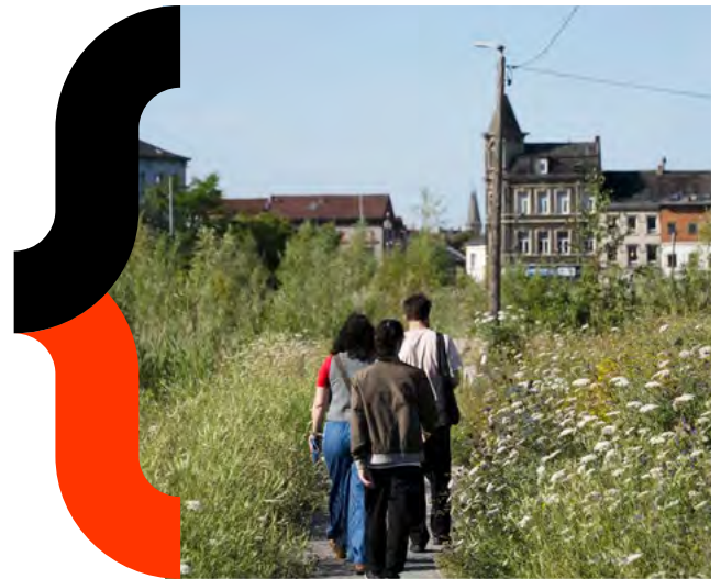
MA Hauts-de-France - Friches en miroir - 2025 ©Collectif HYPER

L'équipe qui les entoure peut être à géométrie et professions variables, offrant ainsi des points de vue et des méthodes de travail variés et complémentaires .