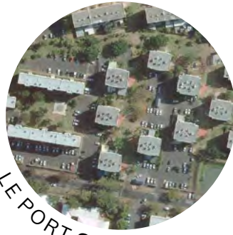
LE PORT 974