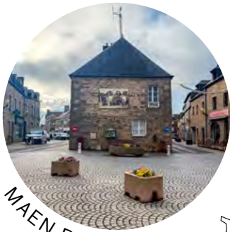
MAEN ROCH 35