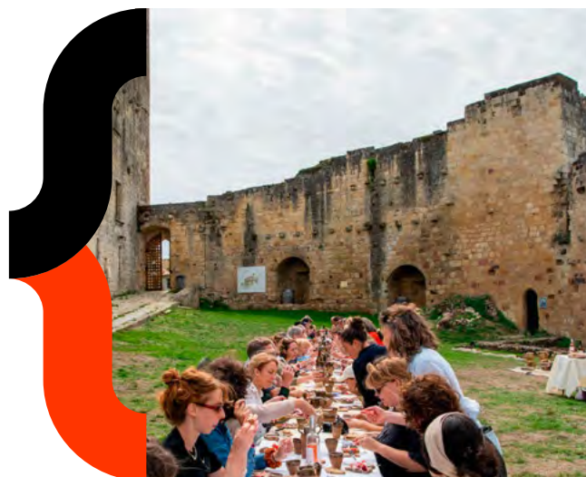
308MA - Terre nourricière - Rauzan - 2025 @Club Photo Rauzannais

Afin de permettre à tous de suivre le déroulement des résidences, chaque équipe créera et alimentera un site/blog dédié à la résidence et pourra produire un support de synthèse présentant leur démarche et leurs réalisations.